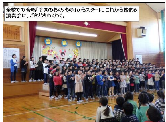
全校での合唱「音楽のおくりもの」からスタート。これから始まる演奏会に、どきどきわくわく。